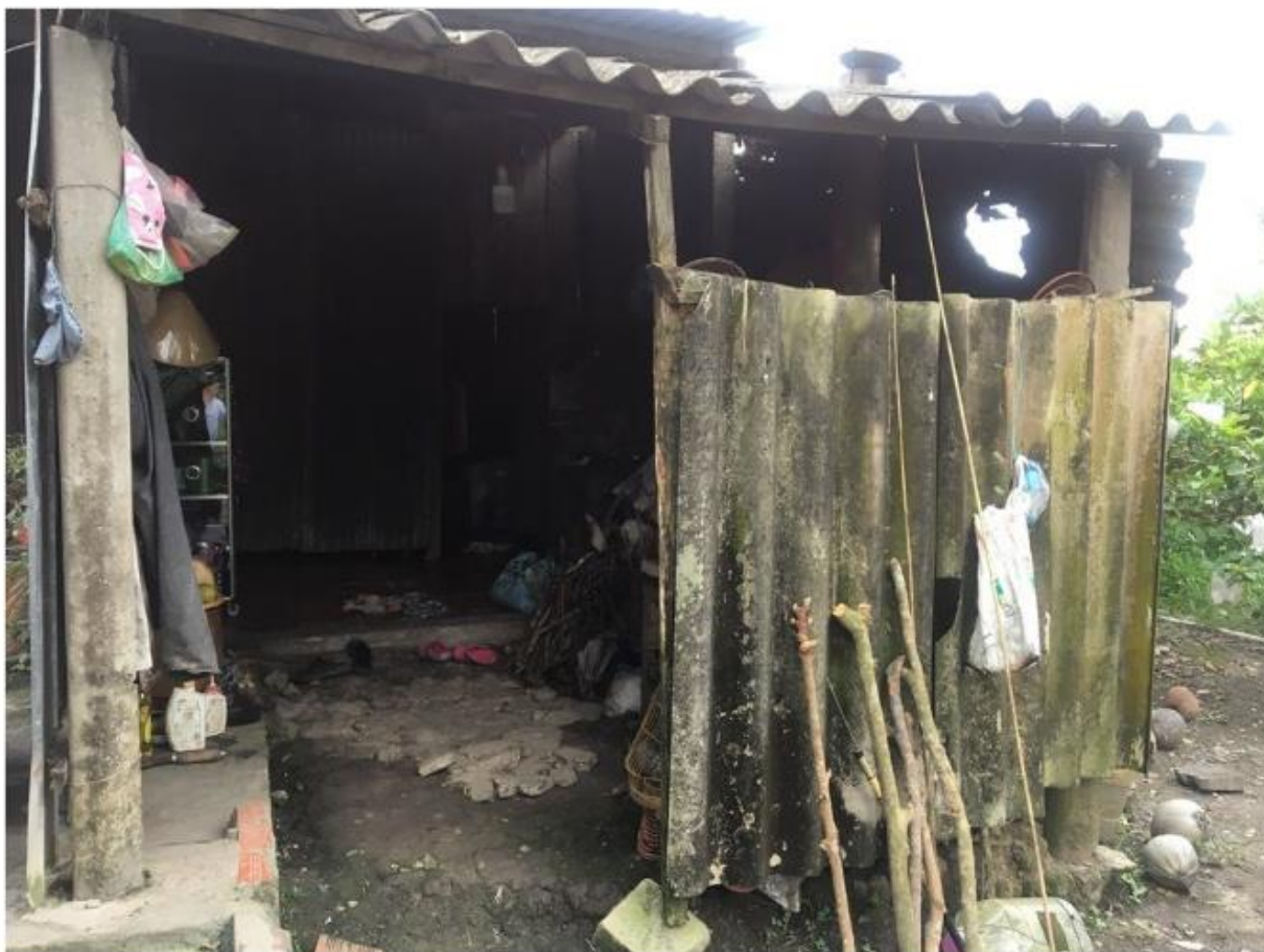
Before Construction Trước khi xây