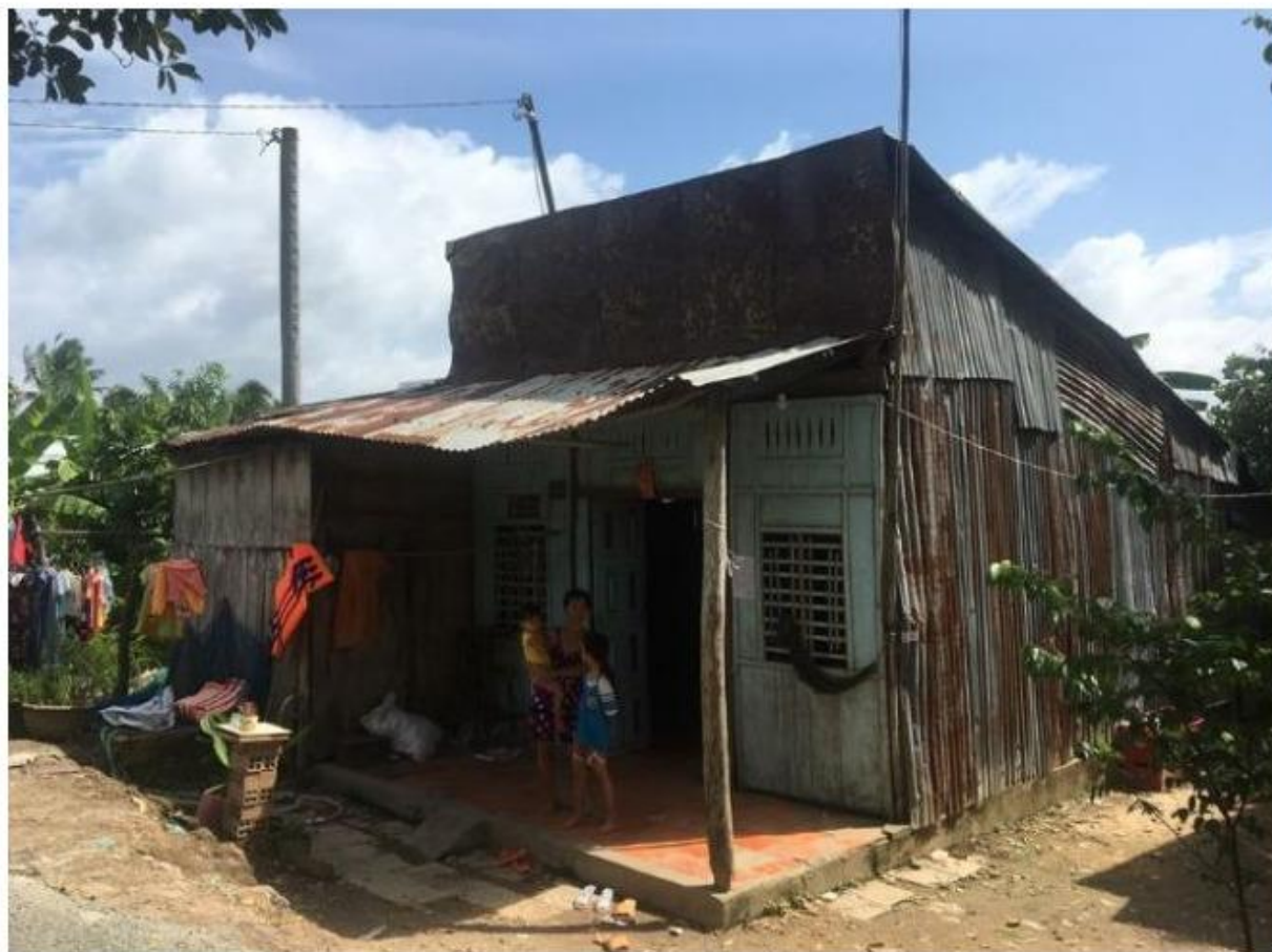
Old House Nhà Cũ